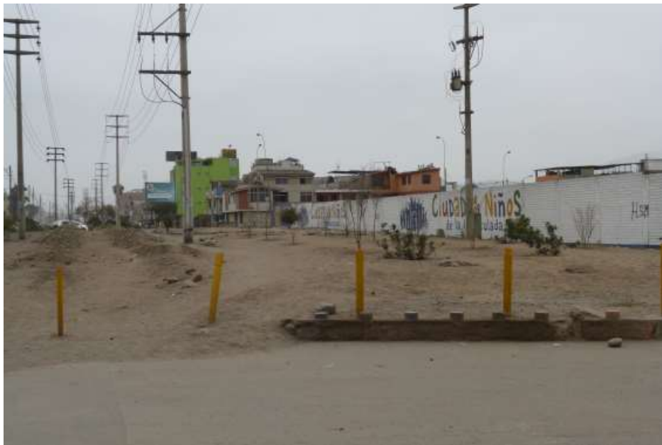
Außenansicht der "Ciudad de los Niños"